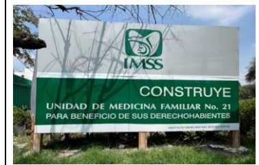
LETRERO DE OBRA