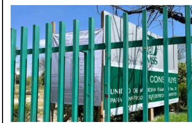
VISTA ACTUAL DEL PREDIO