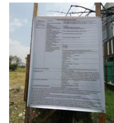
CEDULA DE PUBLICITACIÓN VECINAL