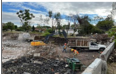
TRABAJOS DE DEMOLICIÓN DE CIMENTACIÓN EXISTENTE