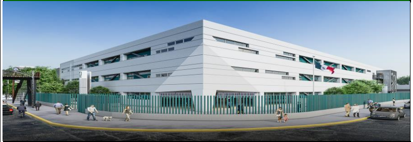
PERSPECTIVA EXTERIOR DE LA UNIDAD