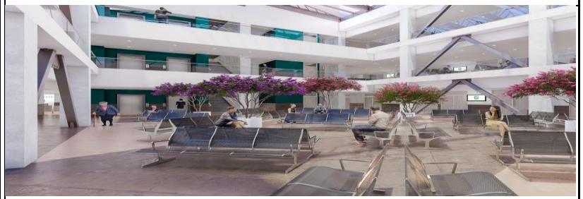
PERSPECTIVA INTERIOR DE LA UNIDAD