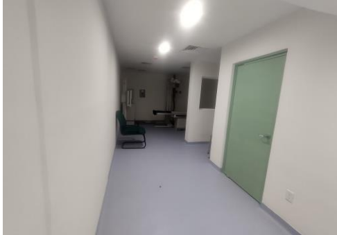
CIERRE SEMANA ACTUAL