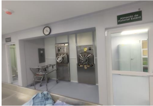
CIERRE SEMANA ANTERIOR