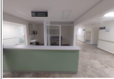
CIERRE SEMANA ANTERIOR