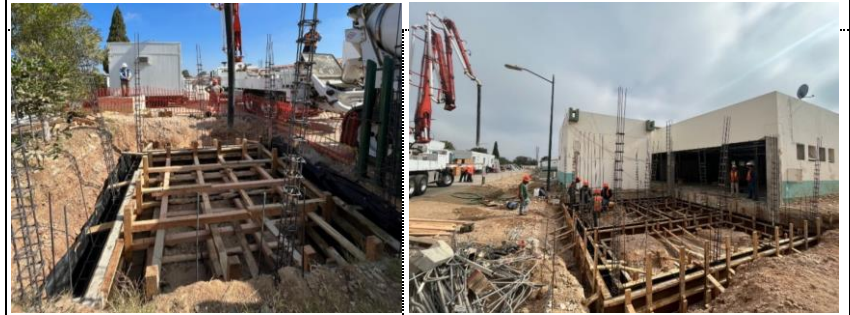
Colado de zapatas en subestación receptora. Colado de zapatas en Taller de conservación