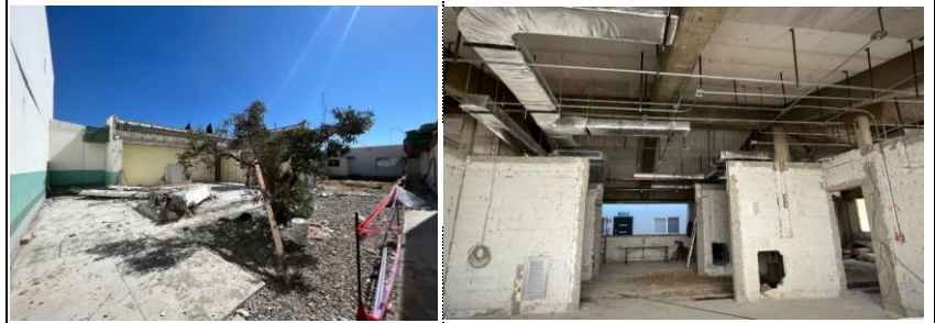
Demolición de muros en archivo clínico. Instalación de tubería de cobre para red de hidráulica.