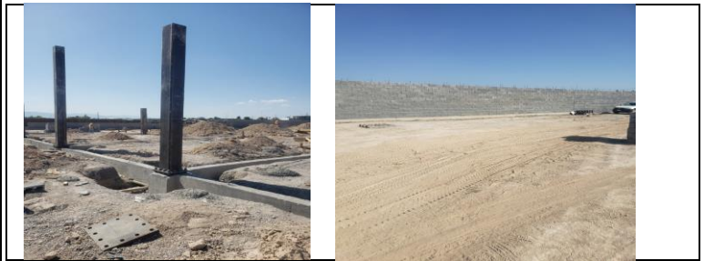
Columnas principales edificio "A"