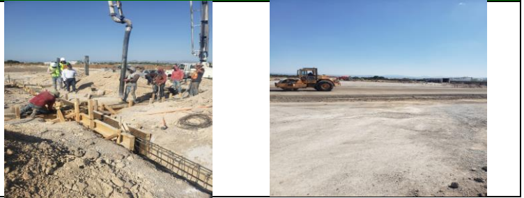
Colado de Trabes y Dados Edificio "A"