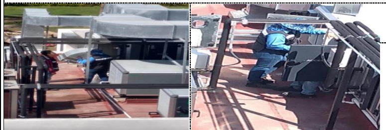
Personal Técnico Klimatechnic Revisión y preliminares para el arranque y pruebas del equipo de HVAC.