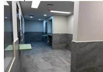
4.AREA DE ENTREGAS