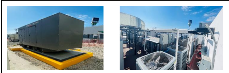
Planta de Emergencia