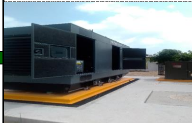
PRUEBA EN VACIO DE EQUIPO DE PLANTA DE EMERGENCIA