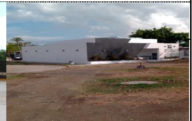
PANORAMICA DELCENTRO DE MEZCLAS