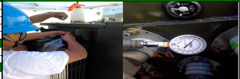
TRABAJOS DE AJUSTE DE EMPAQUE EN TRANSFORMADOR