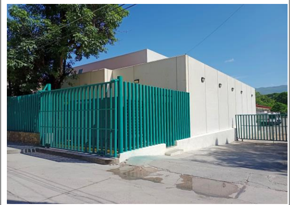
FACHADA PRINCIPAL ACCESO SERVICIOS HOSPITAL