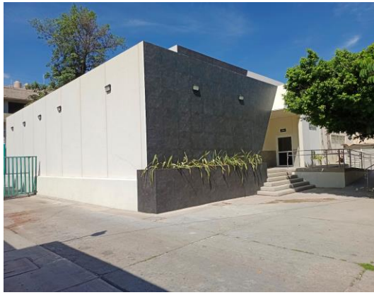
FACHADA PRINCIPAL EN INTERIOR HOSPITAL