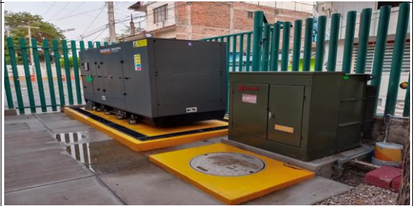
INTERCONEXION DE PLANTA DE EMERGENCIA Y TRANSFORMADOR