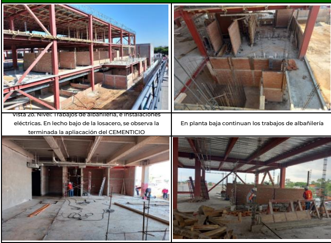
Vista 2o. Nivel: Trabajos de albanilería, e instalaciones eléctricas. En lecho bajo de la losacero, se observa la terminada la aplicación del CEMENTICIO