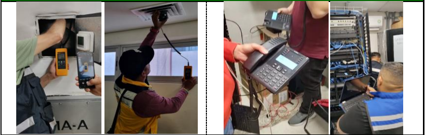
PLANTA ALTA.- Balanceo de rejillas para la próxima entrega de la losa de azotea y equipos de aire acondicionado.