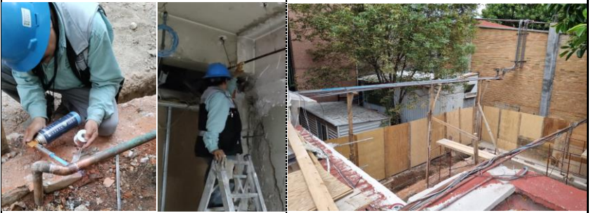
PLANTA BAJA.- Desmantelamiento de instalaciones encontradas en las areas liberadas de la 2da etapa.