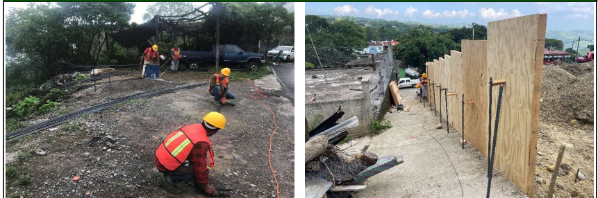
Habilitado de acero de refuerzo