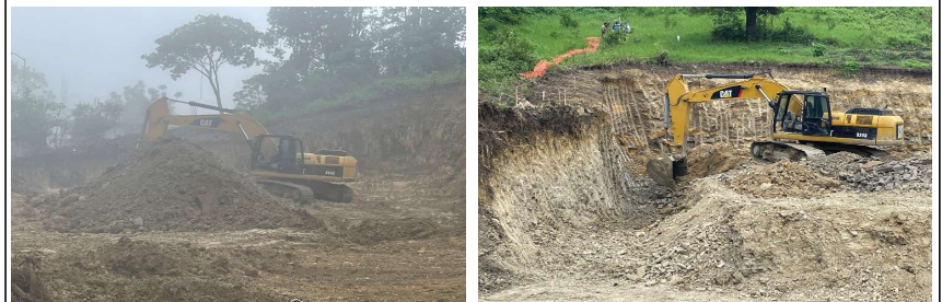
Lluvia intensa registrada durante la jornada que impidio la carga del material producto del corte