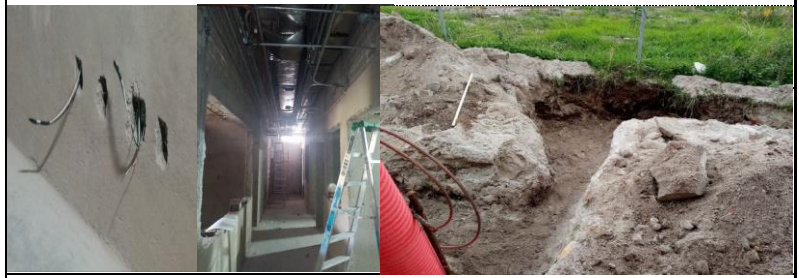
Colocación de canalizaciones y cableado eléctrico para contactos normales, regulados, colocación de ductos de aire acondicionado