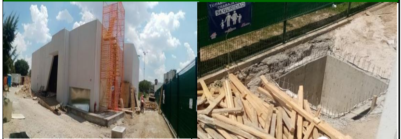
Vista panorámica del Centro de Mezclas (Ingreso Principal)