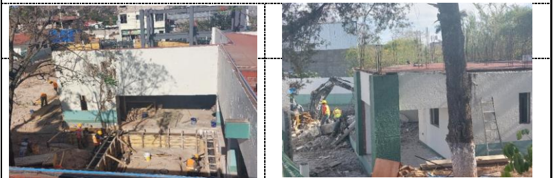
Suministro y colocación de acero de refuerzo en dados, zapata corrida y contratraves en Consultorios de Consulta Externa.