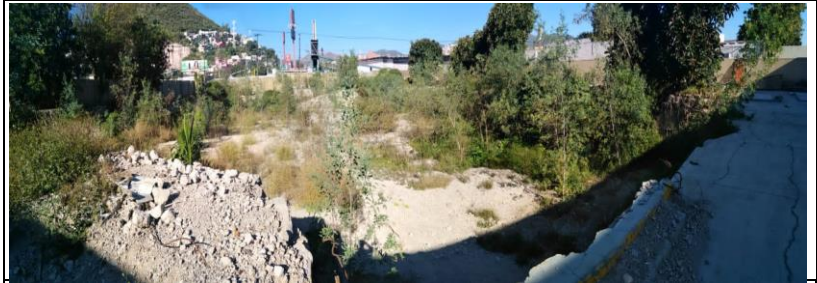
VISTA ACTUAL DEL PREDIO