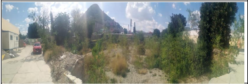
VISTA ACTUAL DEL PREDIO