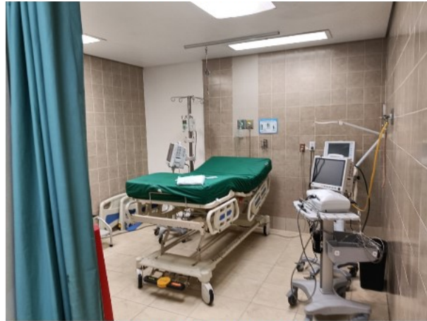
INTERIOR DEL INMUEBLE