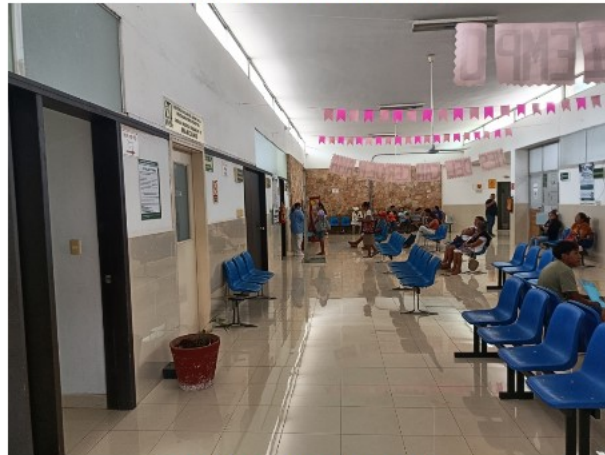
INTERIOR DEL INMUEBLE