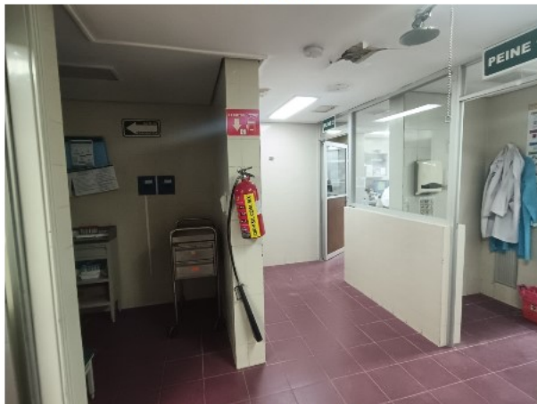
INTERIOR DEL INMUEBLE