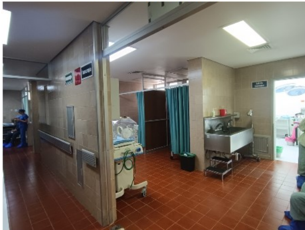
INTERIOR DEL INMUEBLE