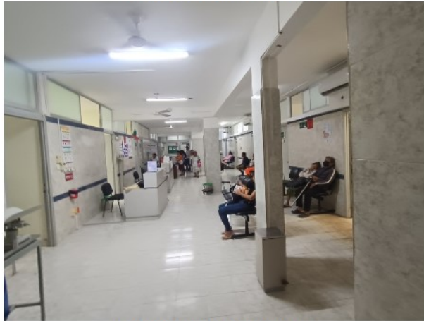
INTERIOR DEL INMUEBLE

SOLICITUD: 2025-4704 SECUENCIAL: 04-25-652 GENÉRICO: G-44169-ZND