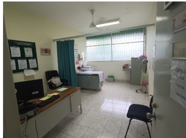
INTERIOR DEL INMUEBLE