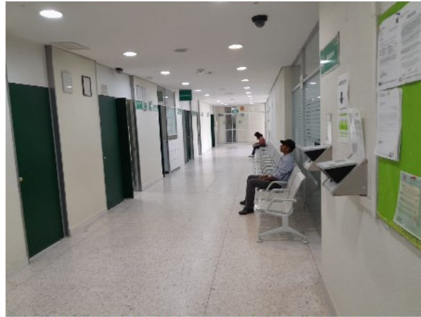
VISTA INTERIOR DEL ACTIVO EN ESTUDIO