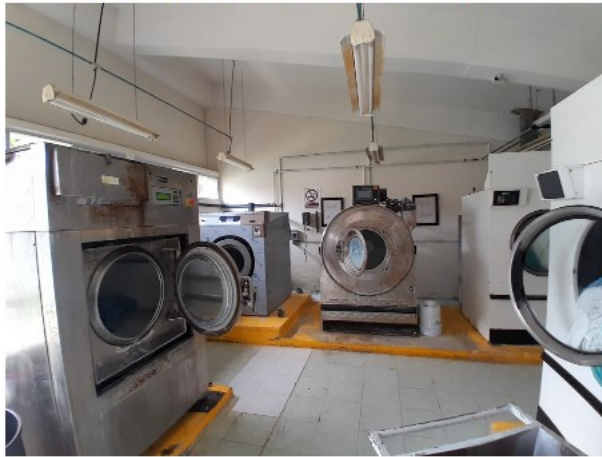
VISTA INTERIOR DEL ACTIVO EN ESTUDIO