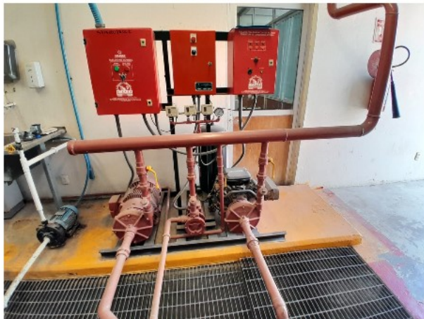
VISTA INTERIOR DEL ACTIVO EN ESTUDIO