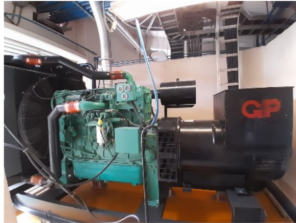
VISTA INTERIOR DEL ACTIVO EN ESTUDIO