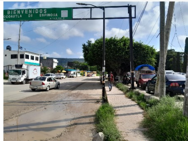
VISTA DEL ENTORNO DEL ACTIVO EN ESTUDIO