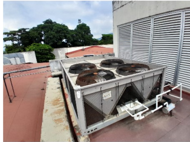
VISTA INTERIOR DEL ACTIVO EN ESTUDIO