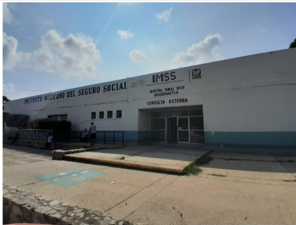
VISTA DE FACHADA DEL ACTIVO EN ESTUDIO