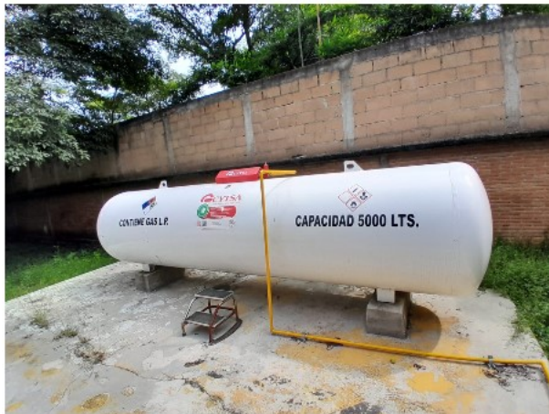
VISTA INTERIOR DEL ACTIVO EN ESTUDIO