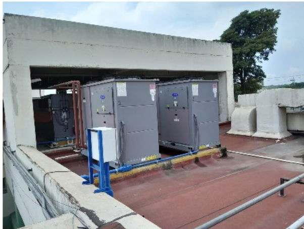
VISTA INTERIOR DEL ACTIVO EN ESTUDIO