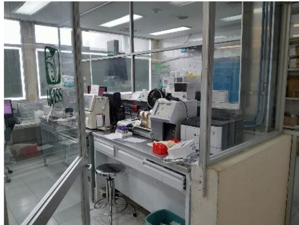
VISTA INTERIOR DEL ACTIVO EN ESTUDIO