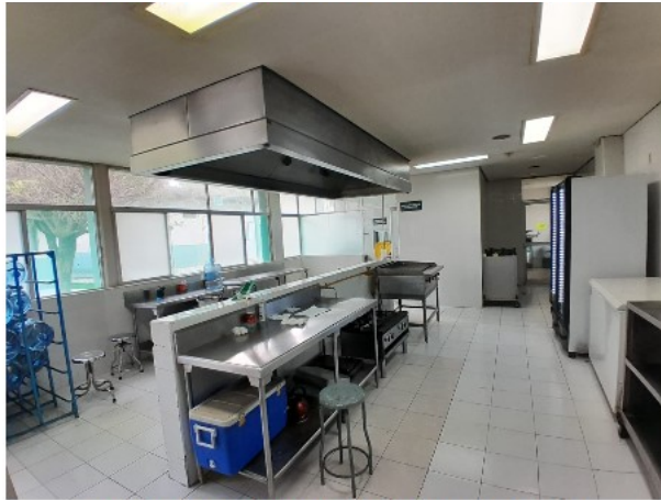
VISTA INTERIOR DEL ACTIVO EN ESTUDIO

SOLICITUD: 2025-4266 SECUENCIAL: 04-25-613 GENÉRICO: G-43925-ZND