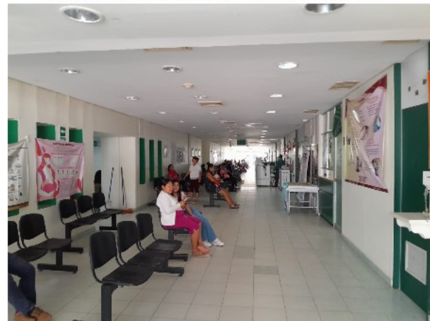
VISTA INTERIOR DEL ACTIVO EN ESTUDIO