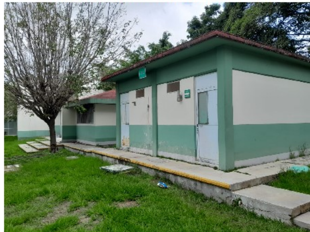
VISTA INTERIOR DEL ACTIVO EN ESTUDIO