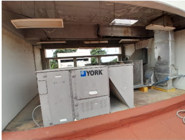
VISTA INTERIOR DEL ACTIVO EN ESTUDIO

SOLICITUD: 2025-4266 SECUENCIAL: 04-25-613 GENÉRICO: G-43925-ZND