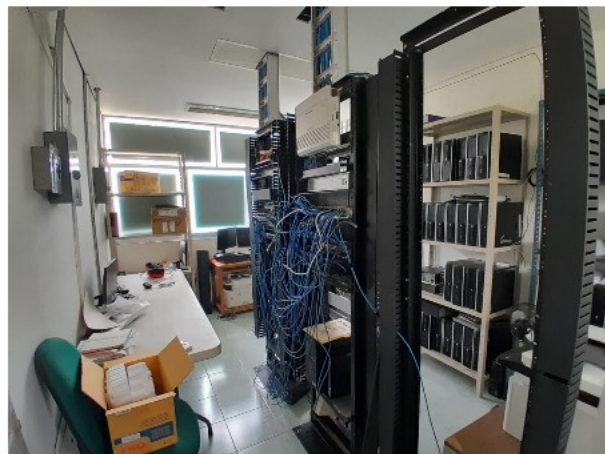
VISTA INTERIOR DEL ACTIVO EN ESTUDIO