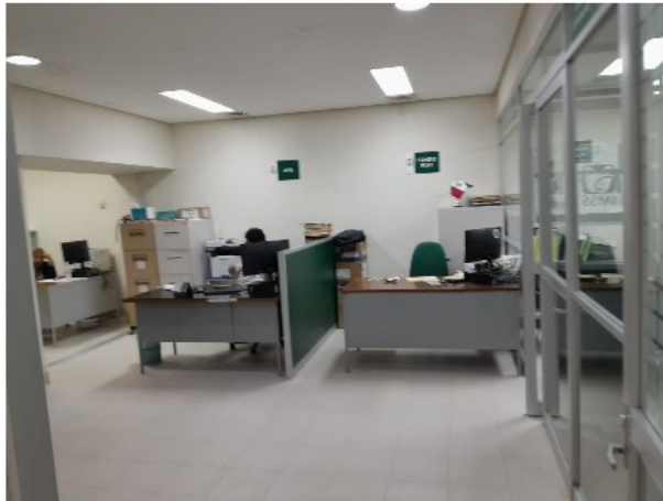
VISTA INTERIOR DEL ACTIVO EN ESTUDIO