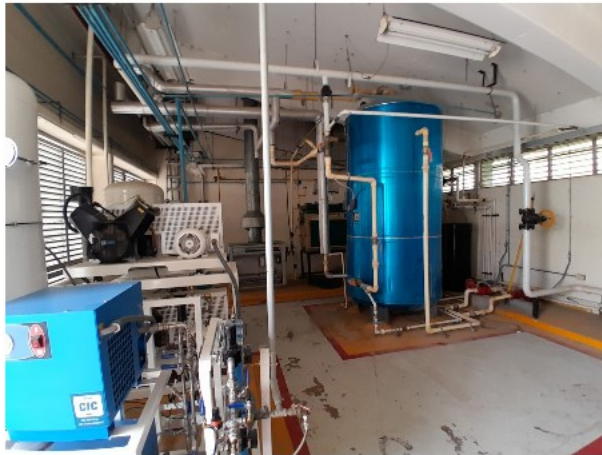
VISTA INTERIOR DEL ACTIVO EN ESTUDIO