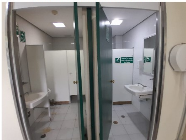
VISTA INTERIOR DEL ACTIVO EN ESTUDIO