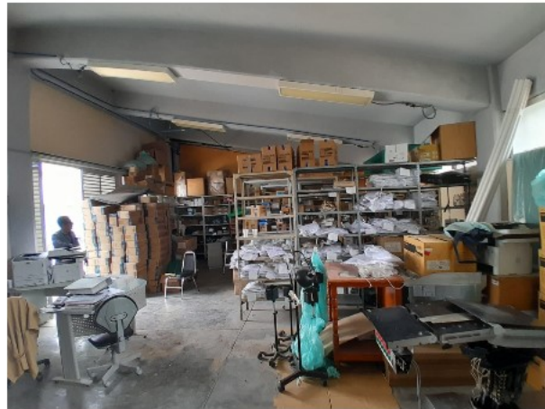
VISTA INTERIOR DEL ACTIVO EN ESTUDIO