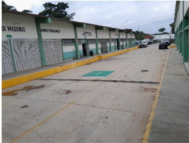
VISTA INTERIOR DEL ACTIVO EN ESTUDIO

SOLICITUD: 2025-4266 SECUENCIAL: 04-25-613 GENÉRICO: G-43925-ZND