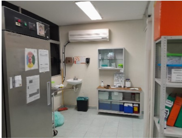
VISTA INTERIOR DEL ACTIVO EN ESTUDIO

SOLICITUD: 2025-4266 SECUENCIAL: 04-25-613 GENÉRICO: G-43925-ZND