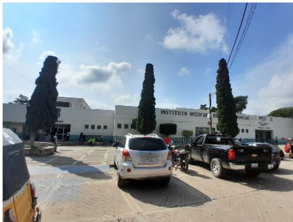
VISTA PANORÁMICA DEL ACTIVO EN ESTUDIO