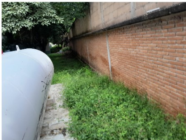
VISTA INTERIOR DEL ACTIVO EN ESTUDIO