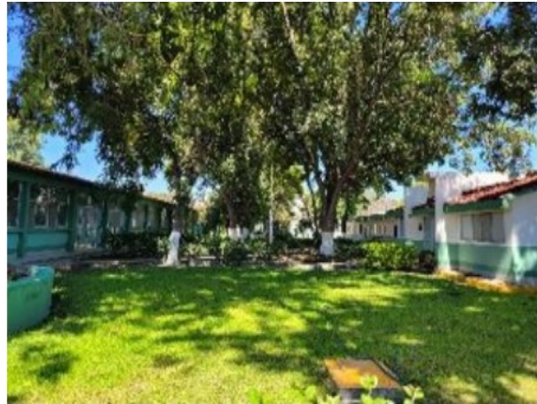
Vista de general del activo en estudio.