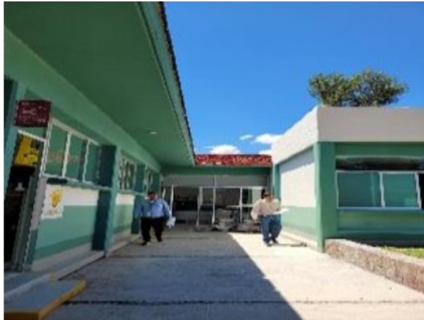
Vista general de entrada urgencias.

SOLICITUD: 2025-3367 SECUENCIAL: 02-25-580 GENÉRICO: G-43179-ZNB