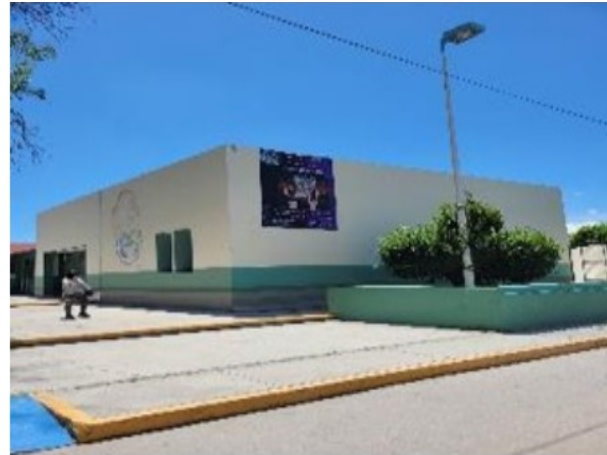
Vista de general del activo en estudio.