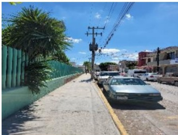
Vista general desde la calle.