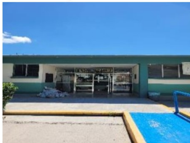
Vista de general del activo en estudio.