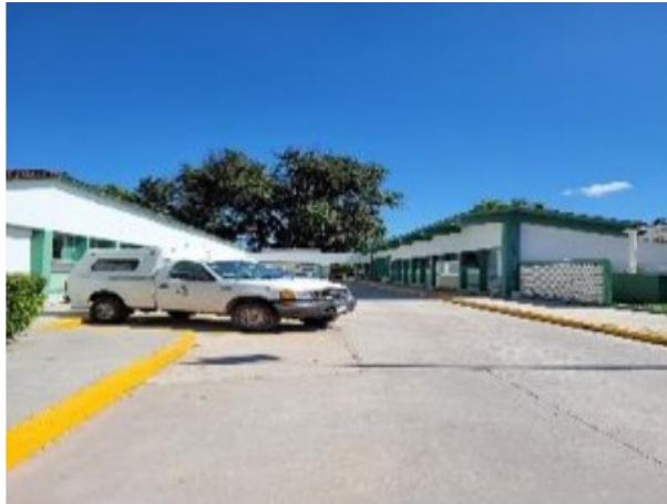
Vista general de entrada urgencias.

SOLICITUD: 2025-3367 SECUENCIAL: 02-25-580 GENÉRICO: G-43179-ZNB