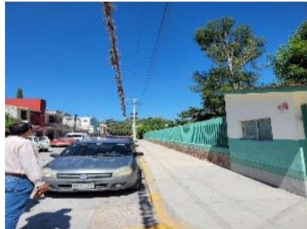
Vista general desde la calle.