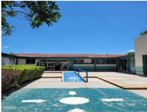
Vista general de entrada urgencias.