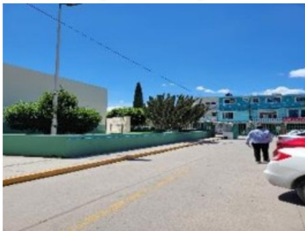
Vista general de entrada urgencias.