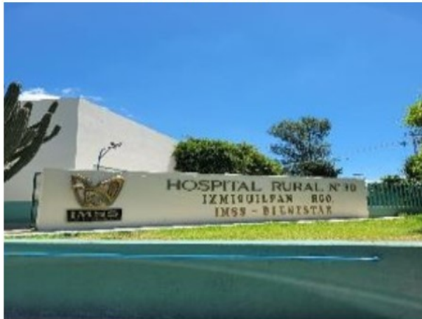
Vista de general de acceso al Activo en estudio.