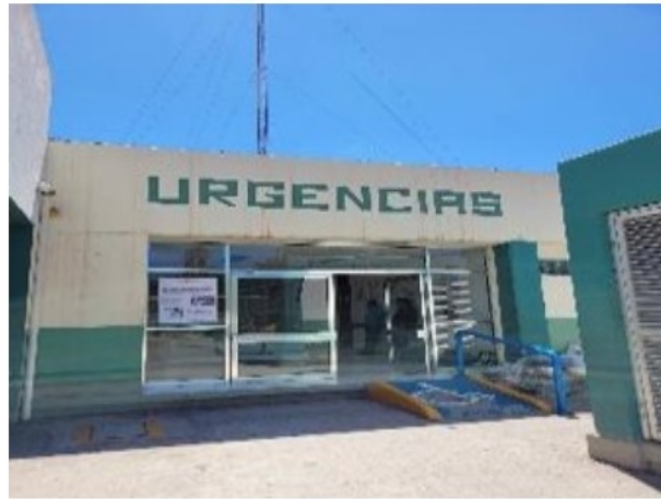
Vista de general del activo en estudio.