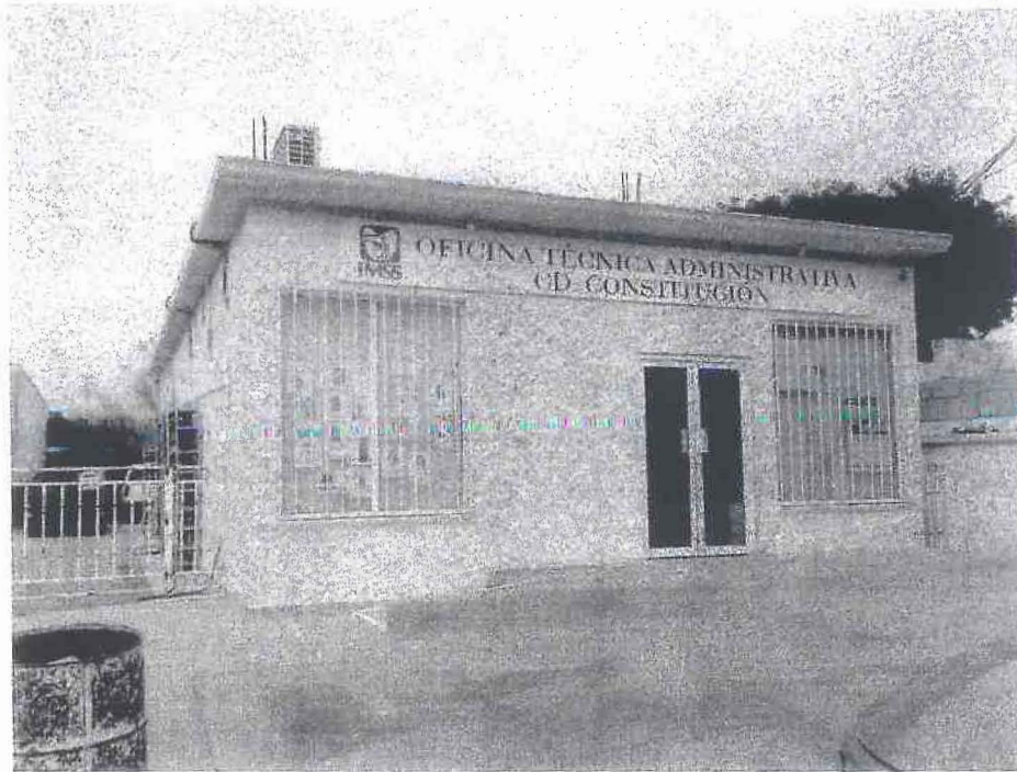
VISTA DE FACHADA PRINCIPAL