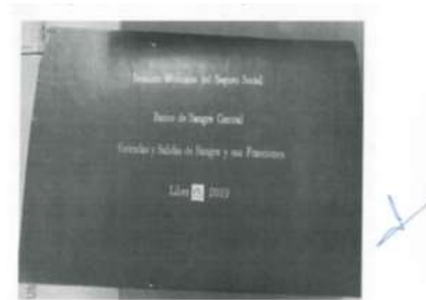
Estudio Análisis Leyenda: como se observa en la fotografía anexo, suministrando el número de libro y el año comenzando con el libro de número 0000000. Modelo: Libro Cantidad: 500 Folios Impresos por ambos lados, empastados, de la siguiente manera: