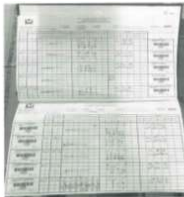
Por cada folio de la parte superior deberá incluir: nombre de cada muestra de sangre suministrada a la clínica. En el primer caso se incluye el número de la muestra.