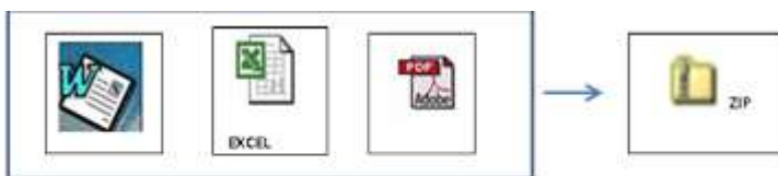
PROPUESTA TECNICA Y LEGAL (Cualquier formato)