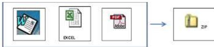
PROPUESTA TECNICA Y LEGAL (Cualquier formato)