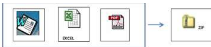
PROPUESTA TECNICA Y LEGAL (Cualquier formato)