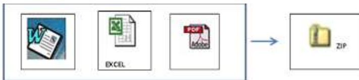
PROPUESTA TECNICA Y LEGAL (Cualquier formato)