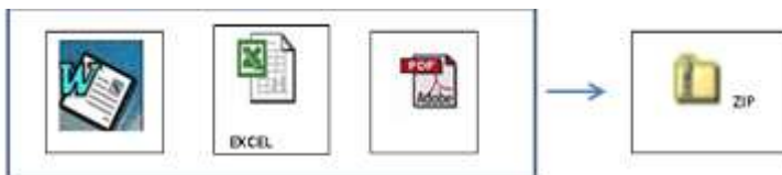
PROPUESTA TÉCNICA Y LEGAL (Cualquier formato)