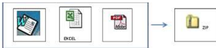
PROPUESTA TECNICA Y LEGAL (Cualquier formato)