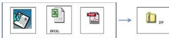
PROPUESTA TECNICA Y LEGAL (Cualquier formato)