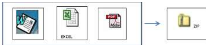
PROPUESTA TECNICA Y LEGAL (Cualquier formato)