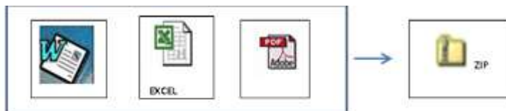
PROPUESTA TECNICA Y LEGAL (Cualquier formato)