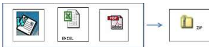
PROPUESTA TECNICA Y LEGAL (Cualquier formato)