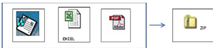
PROPUESTA TECNICA Y LEGAL (Cualquier formato)